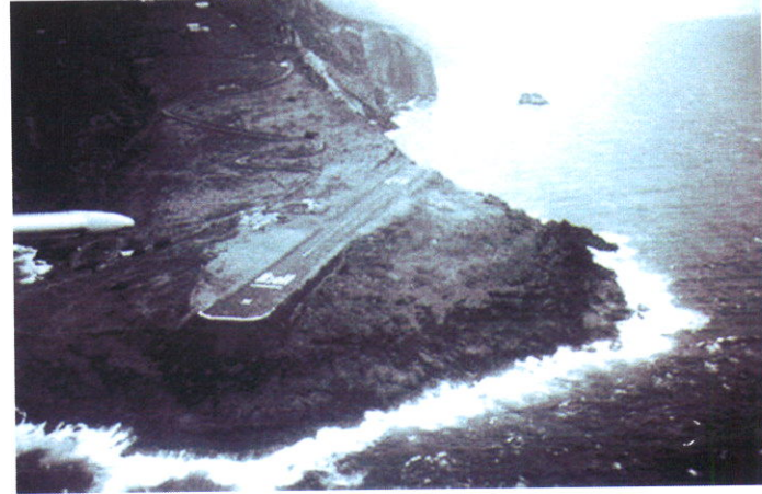
Piste d'atterrissage de l'aéroport de Saba