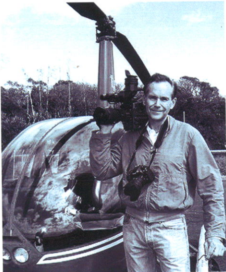
Pierre Brouwers, le réalisateur du film

Le réalisateur Pierre Brouwers vient de sortir un film distribué par Média 9 intitulé « L'Épopée des pionniers de l'aviation dans les Caraïbes », qui retrace un demi-siècle d'aviation aux Antilles.